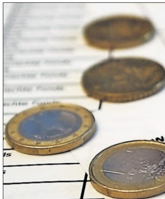
Meldepflicht heißt es ab 2011 für alle größeren Ausgaben. gms

NEUERUNG 2011: Einzelausgaben ab 3500 Euro müssen gemeldet werden