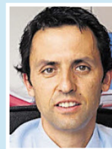
Hubert Berger Kanzlei Lanthaler + Berger + Partner