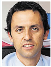
Hubert Berger Kanzlei Lanthaler + Berger + Partner