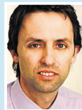
Hubert Berger Kanzlei Lanthaler + Berger + Partner