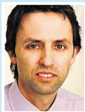
Hubert Berger Kanzlei Lanthaler + Berger + Partner