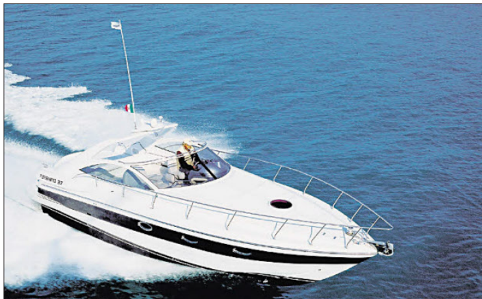
Neben teuren Gütern werden bei der Einkommensschätzung jetzt auch besondere Ausgaben berücksichtigt.

Die Schätzung dieser Ausgaben erfolgt aufgrund der Anzahl der Familienmitglieder und unter Berücksichtigung des jeweiligen Gebietes, in dem sich der Wohnsitz der Steuerpflichtigen befindet. Dazu kommen bedeutende Ausgaben, wie der Kauf von Immobilien und von Autos