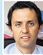
Hubert Berger Kanzlei Lanthaler + Berger + Partner