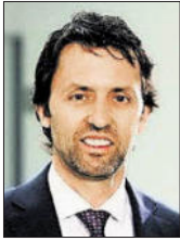
Hubert Berger Kanzlei Lanthaler + Berger + Bordato + Partner